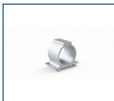
Консольный кронштейн Unit (комплект)