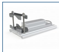
Регулируемый консольный кронштейн (до 82 мм)